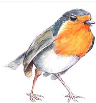
Petirrojo europeo Erithacus rubecula