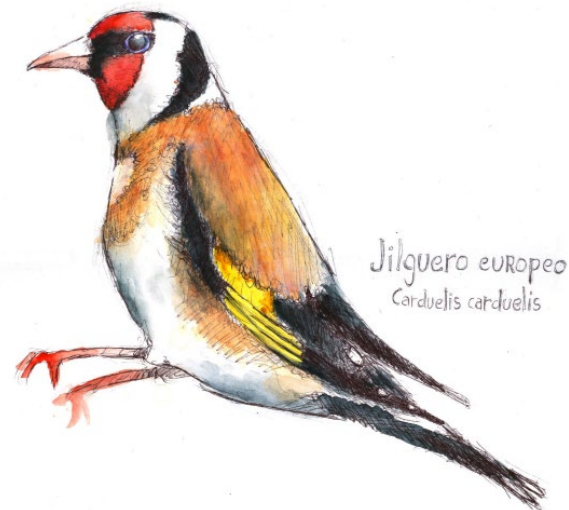
Jilguero europeo Carduelis carduelis